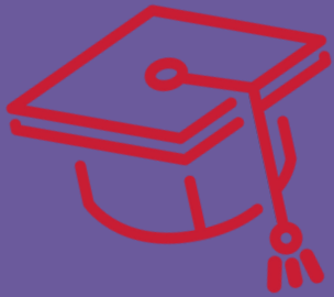
Educatie Centrum Vialisa