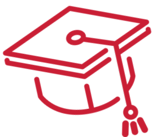
Educatie Centrum Vialisa

Jongeren opleiden, jongeren plaatsen in banen, en het creëren van een omgeving waarin jongeren zich kunnen ontwikkelen.